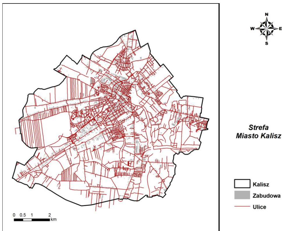
Rysunek 1. Strefa miasto Kalisz

Miasto Kalisz jest jednym z czterech miast na prawach powiatu województwa wielkopolskiego. Usytuowane jest w południowo-wschodniej części województwa wielkopolskiego i sąsiaduje z powiatem kaliskim, ostrowskim oraz pleszewskim. Leży na Wysoczyźnie Kaliskiej, w głębokiej dolinie Proсны.