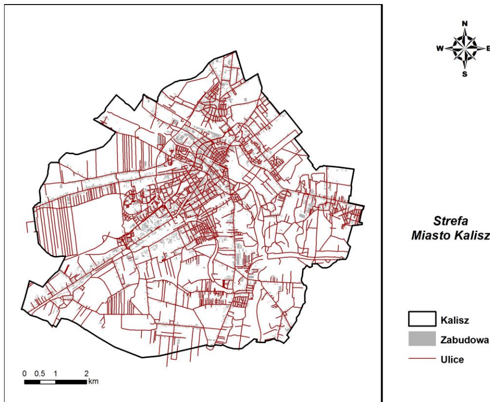
Rysunek 1. Strefa miasto Kalisz

Miasto Kalisz jest jednym z czterech miast na prawach powiatu województwa wielkopolskiego. Usytuowane jest w południowo-wschodniej części województwa wielkopolskiego i sąsiaduje z powiatem kaliskim, ostrowskim oraz pleszewskim. Leży na Wysoczyźnie Kaliskiej, w głębokiej dolinie Proсны.