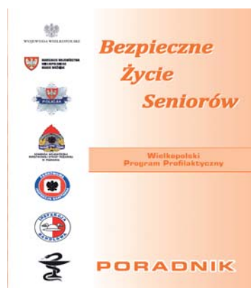
Rys.24. Okładka poradnika „Bezpieczne życie seniorów”

Celem akcji jest uwrażliwienie seniorów na sytuacje zagrażające ich życiu i zdrowiu, w których mogą stać się ofiarami przestępstw. W ramach współpracy z Komendą Policji w Poznaniu, przy wsparciu finansowym Wojewody Wielkopolskiego WSSE w Poznaniu wydrukowała 16000 poradników „Bezpieczne Życie Seniorów”, które będą wykorzystywane podczas spotkań edukacyjnych prowadzonych przez policję i pracowników PIS wśród seniorów w środowiskach lokalnych.