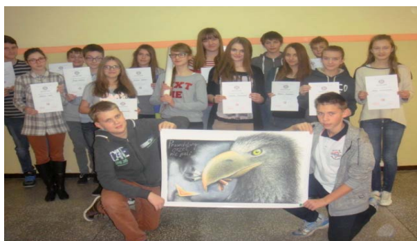
Rys.9. Młodzież po zakończeniu szkolenia z dyplomami „MLZ - kontra tytoń” i plakatem pt. „Prawdziwy orzeł nie pali!” (PSSE Chodzież)