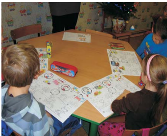
Rys.18. Impreza prozdrowotna „Wiem, jak dbać o zdrowie” Szkoła Podstawowa w Lubini Małej (PSSE Jarocin)