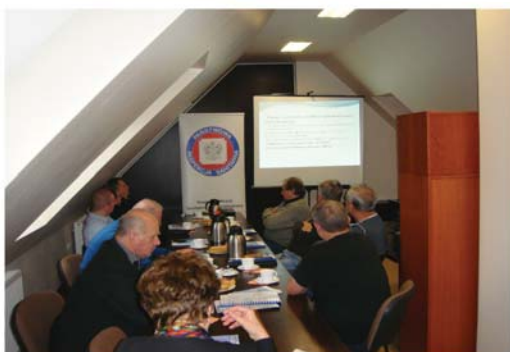
Rys.11. Szkolenie służb BHP (PSSE Jarocin)