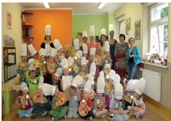
Rys.16. Konkurs kulinarny w Przedszkolu nr 8 w Pile