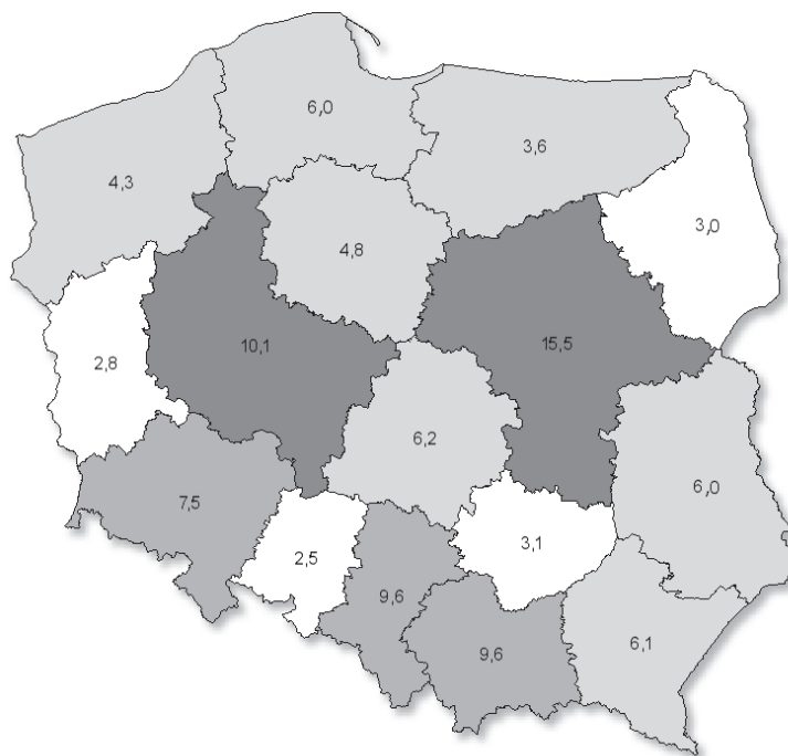
Rycina 1. Udział procentowy poszczególnych województw wśród aktywnych organizacji pozarządowych (dane GUS 2016)

W kontekście porównań międzywojewódzkich należy również zauważyć, iż uwzględniając dysproporcje pomiędzy wielkością populacji województw okazuje się, że w przeliczeniu na 10 tys. mieszkańców różnica pomiędzy Wielkopolską (26,4) a Mazowszem (26,5) jest nieznaczna – przy czym na trzecim miejscu tak rozumianego rankingu plasuje się Podkarpacie (26,3), a najniższy wynik notuje województwo śląskie (18,0). Ze względu na zakres gromadzonych przez statystykę publiczną danych, dotyczą one wyłącznie organizacji rejestrowanych, które uznawane są za aktywne. Innymi słowy, notowany w województwie