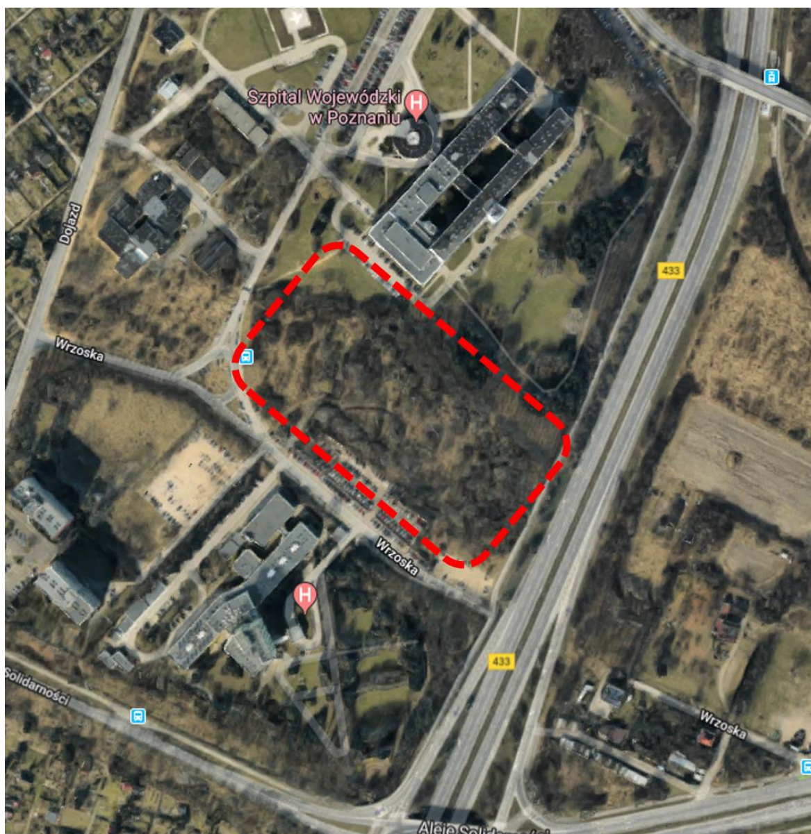
Rys. nr 1 Lokalizacja Wielkopolskiego Centrum Zdrowia Dziecka