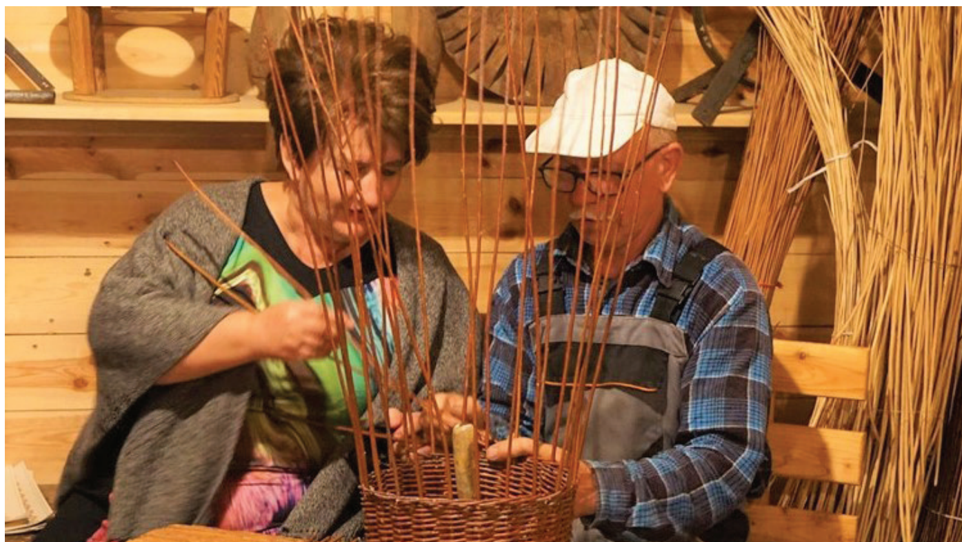
Muzeum Wikliniarstwa w Nowym Tomyślu znalazło się na szlaku wyjazdu studyjnego, zorganizowanego przez Stowarzyszenie „Między Ludźmi i Jeziorami”. Stowarzyszenie prowadzi działalność na terenie czterech gmin powiatu konińskiego: Kleczew, Kazimierz Biskupi, Skulsk oraz Wilczyn.

Efektom współpracy dwóch innych lokalnych grup działania funkcjonujących w naszym regionie jest wyjazd studyjny, który odbył się na początku czerwca 2019 roku. Na zaproszenie Wielkopolskiej Lokalnej Grupy Działania „Kraina Lasów i Jezior”, powiaty leszczyński oraz wolsztyński odwiedzili przedstawiciele Stowarzyszenia „Dolina Noteci” z Chodzieży. Poza pracownikami LGD, w wyjeździe wzięli udział członkowie dwóch chodzieskich stowarzyszeń: Stowarzyszenia Osób po Endoprotezoplastyce Biodra „Bioderko” oraz Stowarzyszenia „Młodość i Doświadczenie”.