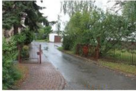
Widok na dz. 222/115

Dane dotyczące nieruchomości położonych w Baranowie ul. Budowlanych 9 oraz warunki przetargu: