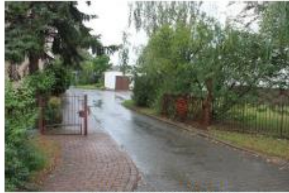
Widok na dz. 222/115

Dane dotyczące nieruchomości położonych w Baranowie ul. Budowlanych 9 oraz warunki przetargu: