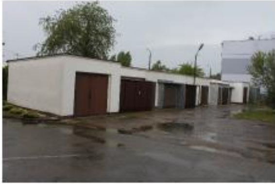
Widok na dz. 222/159