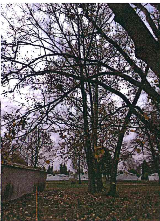
Nr 6 (topola)