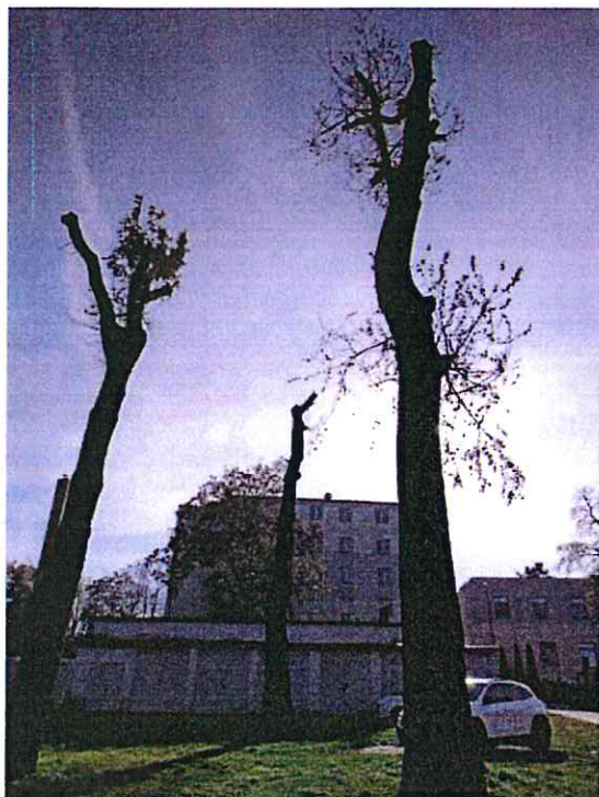
Nr 1 (topola), 2 (jesion), 3 (topola)