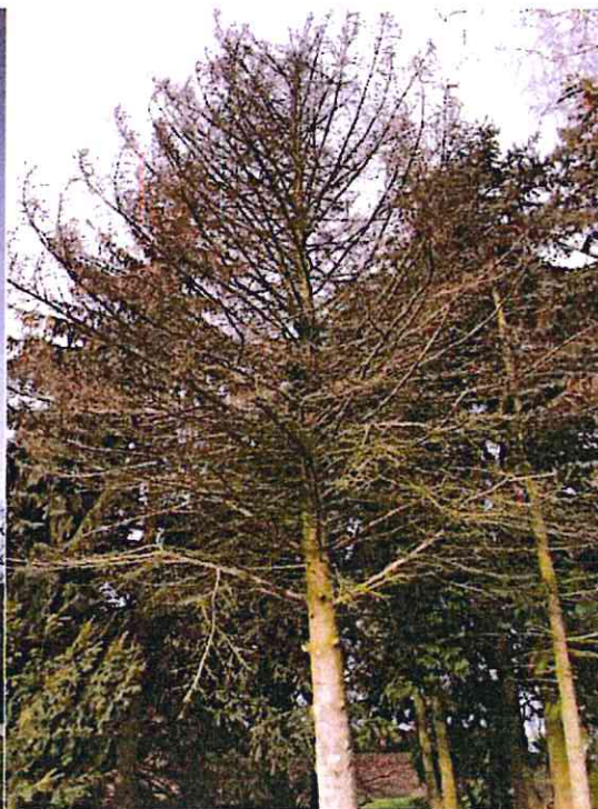
Nr 4 (świerk)