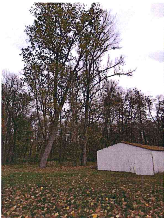
Nr 5 (topola)