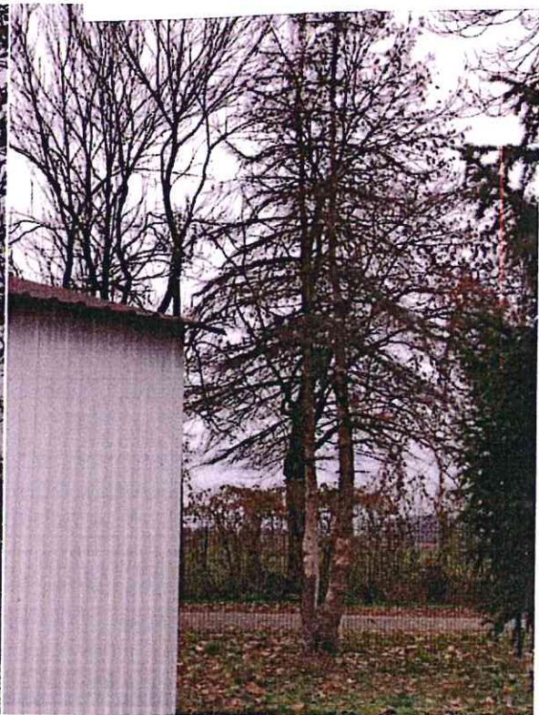
Nr 8 (świerk)