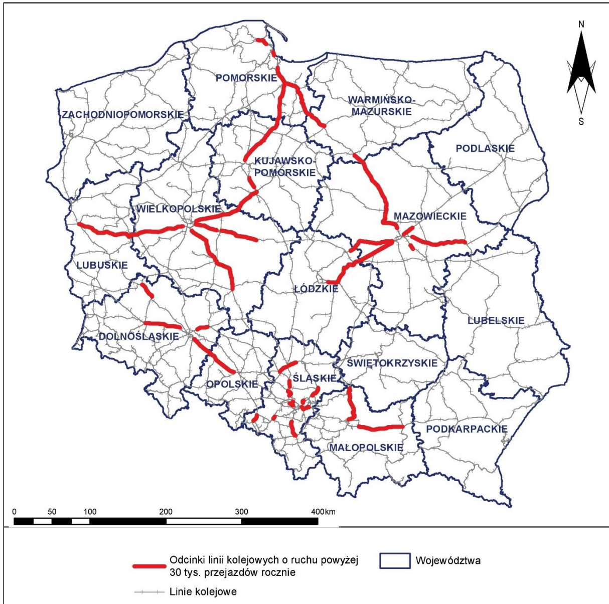
Rys. 1 Lokalizacja analizowanych linii kolejowych na tle województw Polski

Lokalizacje odcinków podlegających mapowaniu akustycznemu na terenie całej Polski oraz przedmiotowego województwa przedstawiono na rys. 1 + rys. 2.