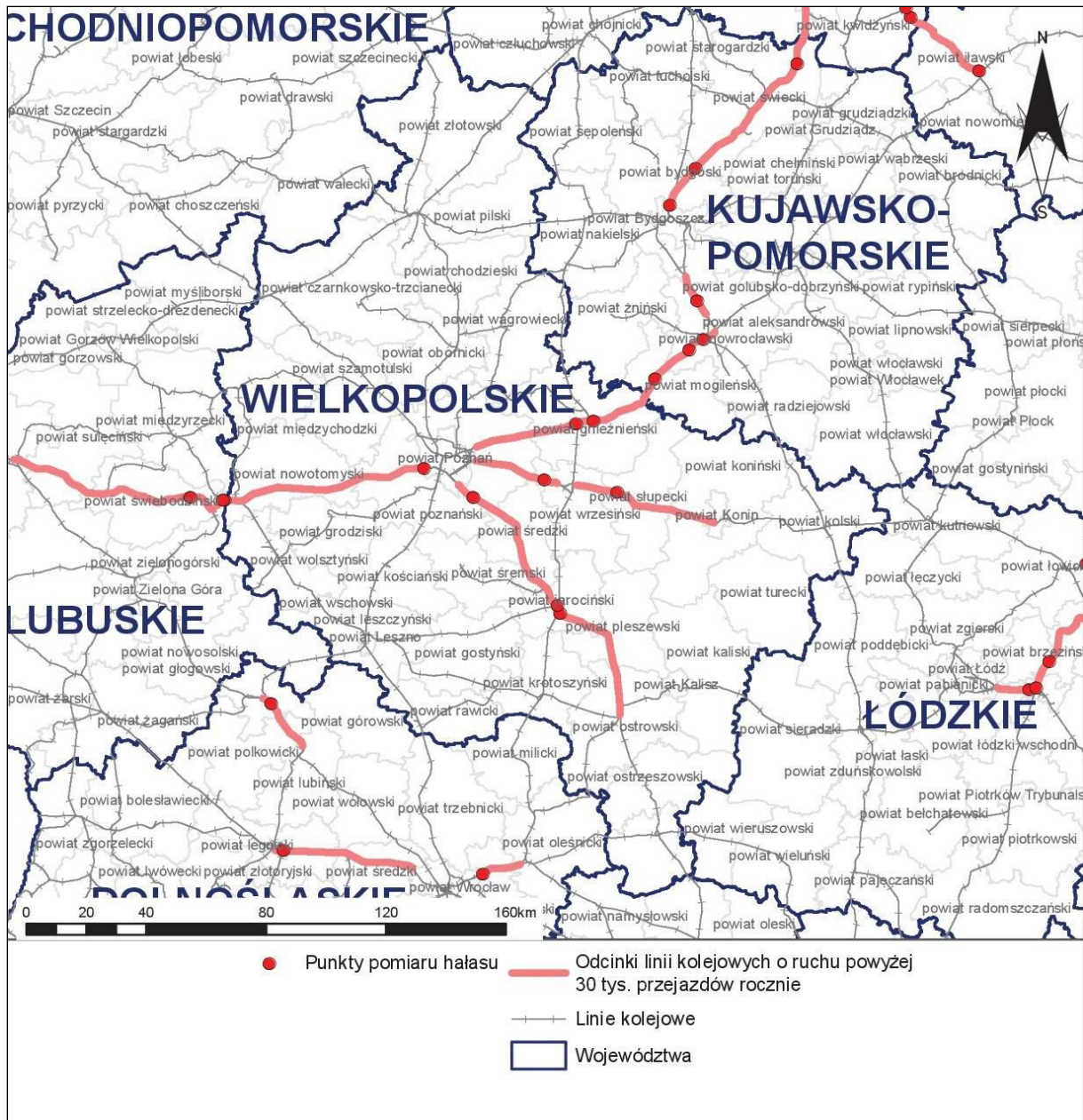
Rys. 4 Lokalizacja punktów pomiarów hałasu kolejowego wykonywanych w ramach opracowania na terenie analizowanego województwa

Właściwej weryfikacji modelu akustycznego dokonano wykorzystując proces kalibracji porównując metodę obliczeniową z metodą pomiarową. W procesie kalibracji wykorzystano wyniki pomiarów z 146 lokalizacji obejmujących odcinki jednorodnego pod względem warunków eksploatacyjnych, przy których możliwe było wykonanie pomiarów hałasu zgodnie z wymaganiami procedury pomiarów ekspozycyjnych dźwięku w odniesieniu do pojedynczych zdarzeń akustycznych. Proces kalibracji przeprowadzono dla danych zarejestrowanych dla pory nocnej, która ze względów akustycznych jest bardziej newralgiczna. Warunek konieczny równoważności metody pomiarowej i obliczeniowej, zgodnie z zapisem punktu H „Procedura obliczeniowa” załącznika nr 3 do rozporządzenia [4], został zachowany. Otrzymany wynik wynosi 2,4 dB, co świadczy o poprawności przyjętego modelu obliczeniowego.