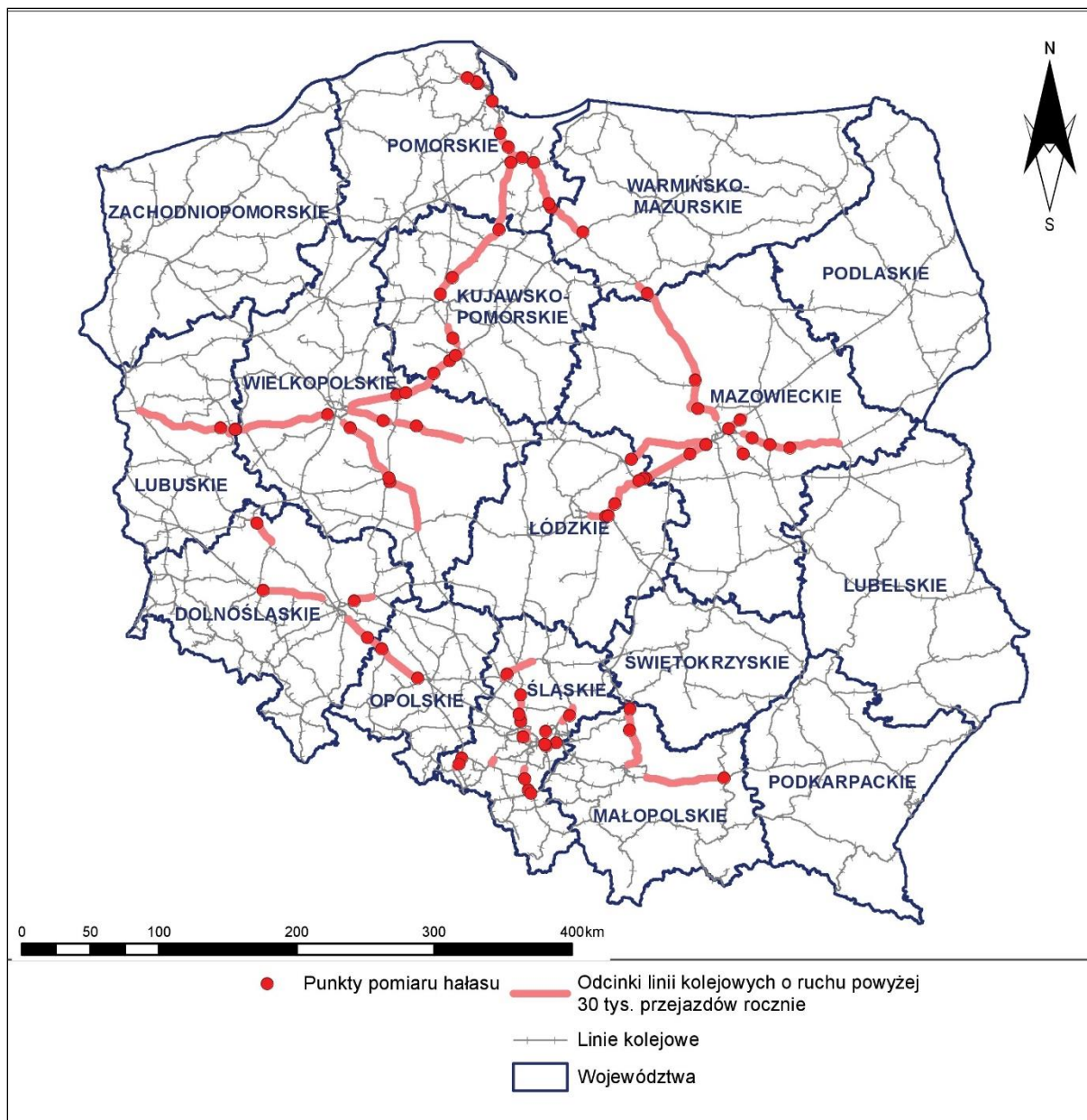
Rys. 3 Lokalizacja wszystkich punktów pomiarów hałasu kolejowego wykonywanych w ramach opracowania na tle województw Polski