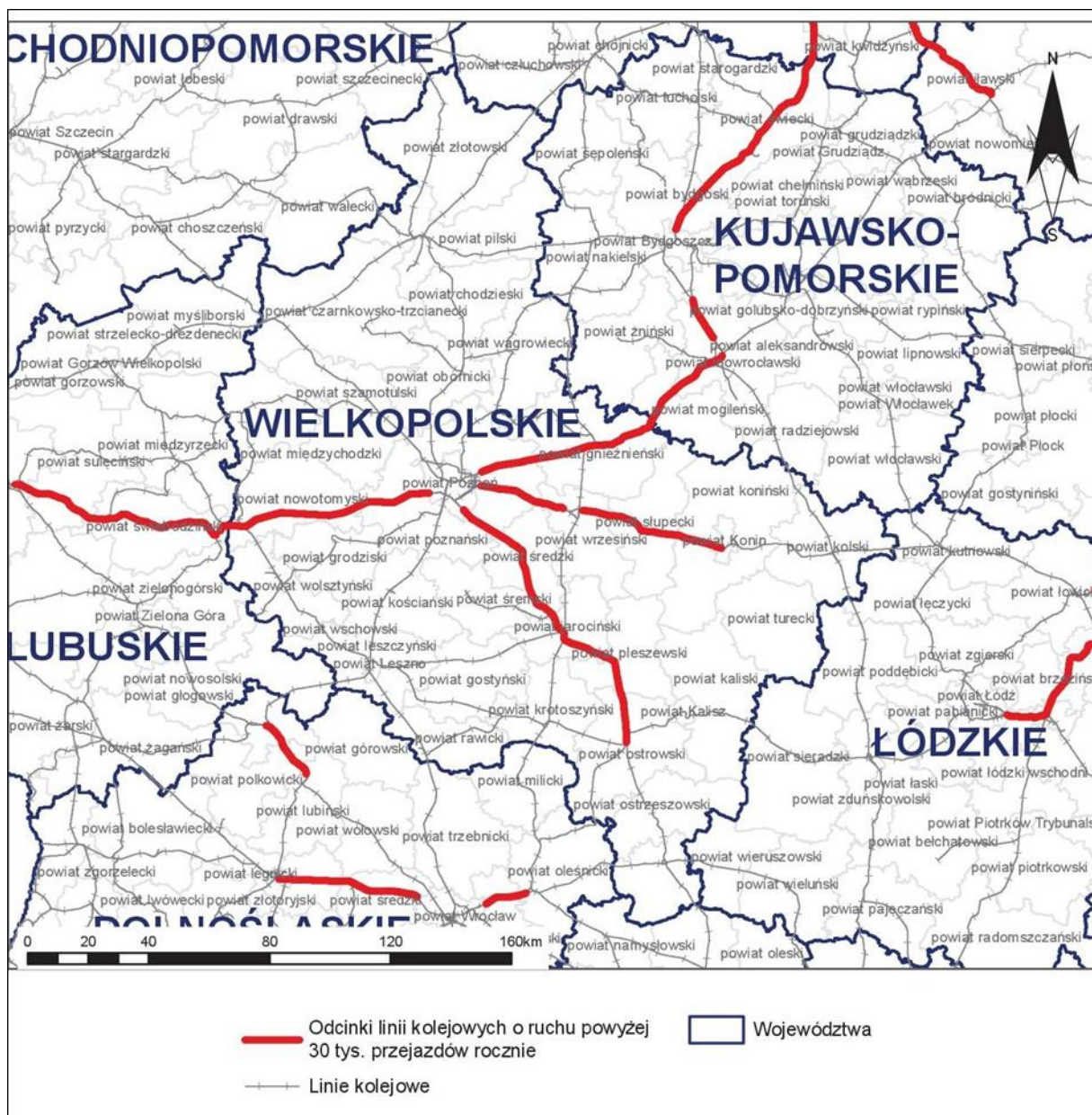
Rys. 2 Lokalizacja analizowanych linii kolejowych na tle analizowanego województwa

Województwo wielkopolskie zlokalizowane jest w zachodniej części Polski. Graniczy od zachodu z województwem lubuskim, od wschodu – z kujawsko-pomorskim i łódzkim, od południa z dolnośląskim i opolskim, a od północy z zachodniopomorskim i pomorskim.