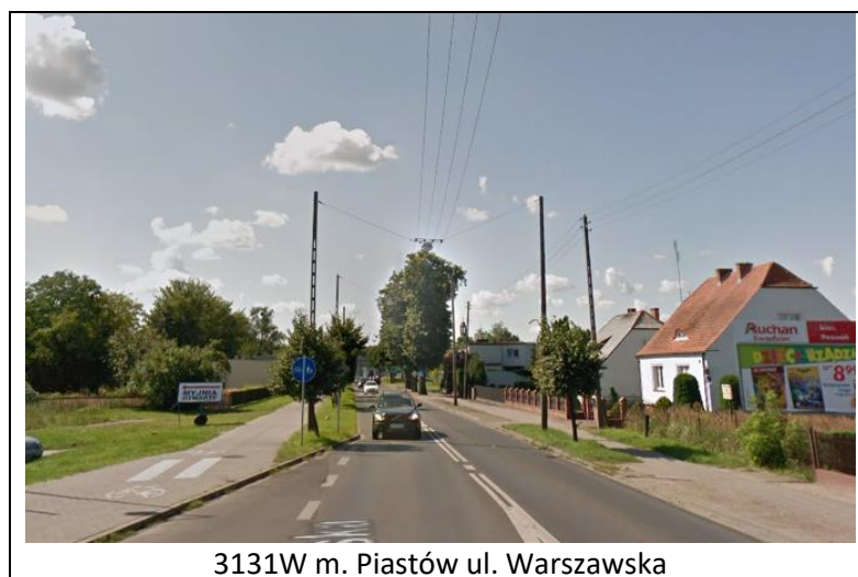
Rysunek 2.2 Materiał fotograficzny wybranych odcinków dróg