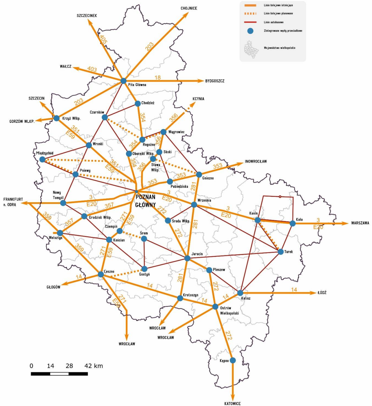
Rys. 4. Sieć komunikacyjna w województwie wielkopolskim dla przewozów o charakterze użyteczności publicznej